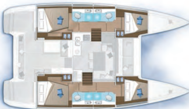
4 cabines, 4 salles d'eau / 4 cabins, 4 bathrooms