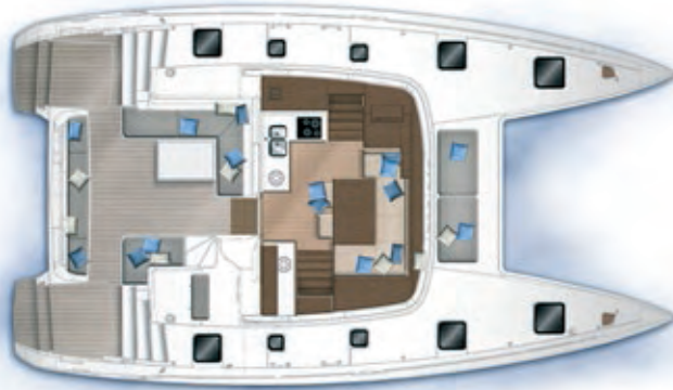
Carré et cockpit / Saloon and cockpit