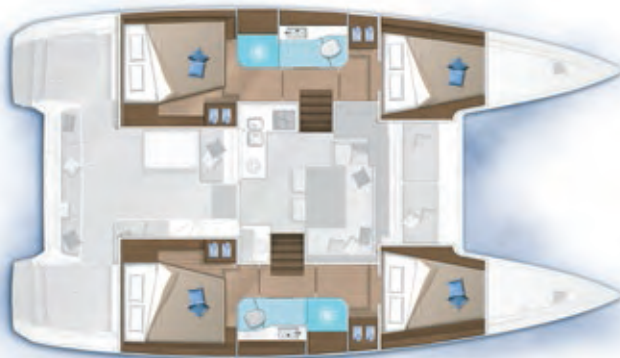
4 cabines, 2 salles d'eau / 4 cabins, 2 bathrooms