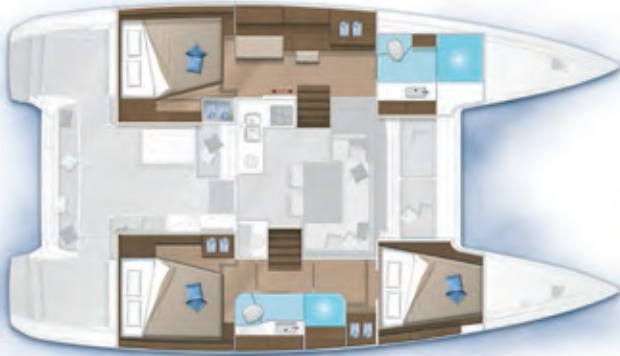
3 cabines, 2 salles d'eau / 3 cabins, 2 bathrooms