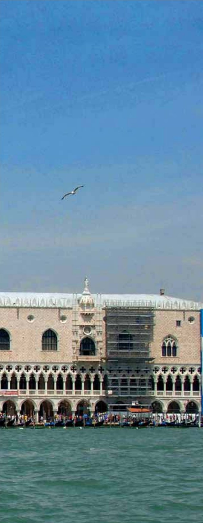
Piazza San Marco, laguna di Venezia

Tre magnifiche regioni da esplorare....quale scegliere ?