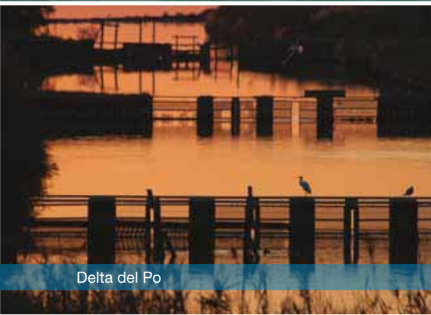
Delta del Po