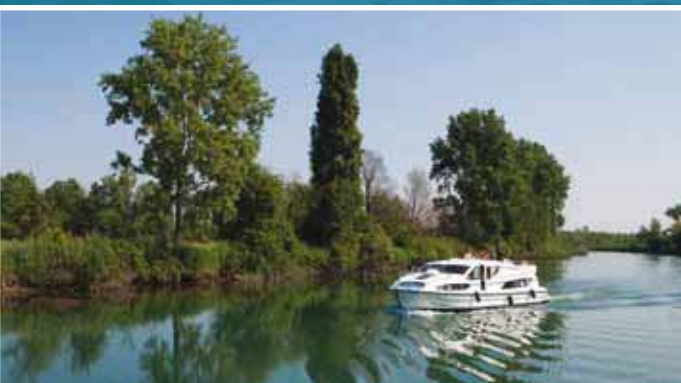
Fiume Stella, Preconicco