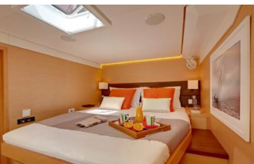
LAGOON 620 6 cabine 6 wc